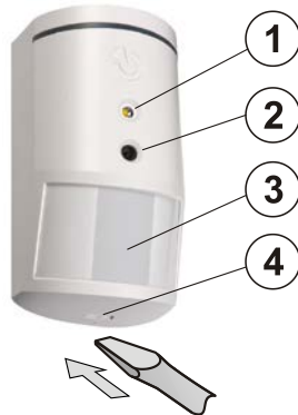
Abbildung: 1 – Blitz zur Belichtung; 2 – Kameralinse; 3 – PIR-Melderlinse; 4 – Abdeckungs-lasche;

Der Melder kann an einer Wand oder in der Zimmerecke montiert werden. Im Erkennungsbereich des Melders sollte es keine Hindernisse geben, die schnell die Temperatur ändern (z. B. Heizgeräte) oder sich bewegen (z. B. Vorhänge, die über einem Heizkörper hängen, Roboterstaubsauger, Haustiere). Wir empfehlen nicht, den Melder gegenüber von Fenstern oder an Orten mit zu starker Luftzirkulation (in der Nähe von Ventilatoren, Wärmequellen, Klimaanlageausgängen, offenen Türen usw.) zu montieren. Vor dem Melder sollte es keine Hindernisse geben, die den überwachten Erfassungsbereich beeinträchtigen könnten.